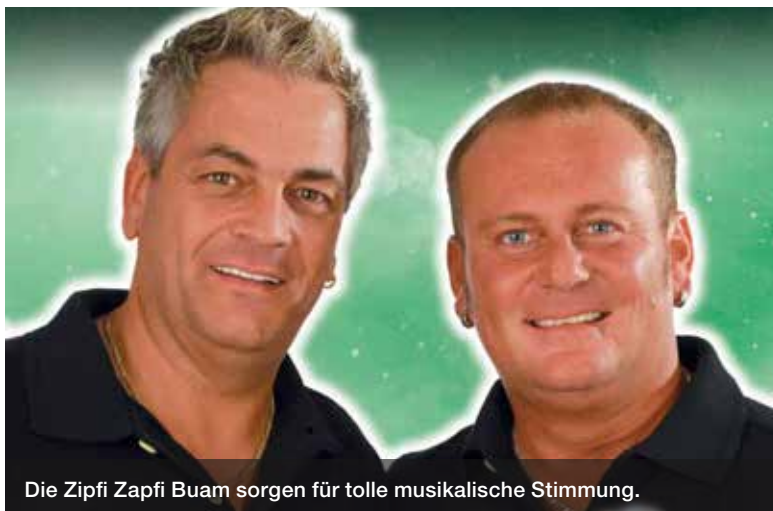
Die Zipfi Zapfi Buam sorgen für tolle musikalische Stimmung.

Mit dem «Grossen Buurezmorge» startet die GEWA, in Zusammenarbeit mit dem Verein Dorf-Märt, um 9 Uhr in den GEWA-Sonntag. Regionale Produkte können mit einem abwechslungsreichen Rahmenprogramm á discrétion bis 13 Uhr ausgiebig genossen werden. Erwachsene zahlen CHF 29.-/Person, Kinder bis 12 Jahre CHF 2.-/Altersjahr. Ticketbestellung unter cl.columberg@bluewin.ch oder am 7. Ok-